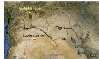
Mesopotamia: "the land between the rivers" Gobekli Tepe is located in the northwestern Mesopotamia.

In alle oude literatuur wordt gerefereerd aan de zondvloed (tussen 12.800 en 12.400 jaar geleden). Wetenschappelijk is vastgesteld dat de zeespiegel 100 m is gestegen op aarde. Wij hebben als mensensoort dit meegemaakt en moesten kennelijk opnieuw beginnen. De wereld is miljarden jaren oud, de mensheid tweehonderd duizend jaar oud. De geschiedenis is nog maar 5000